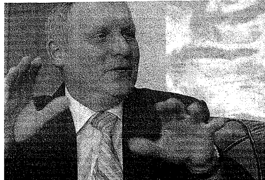
der był bardzo ceniony przez mieszkańców. W ostatniej drodze żegnały go tysiące miesz-